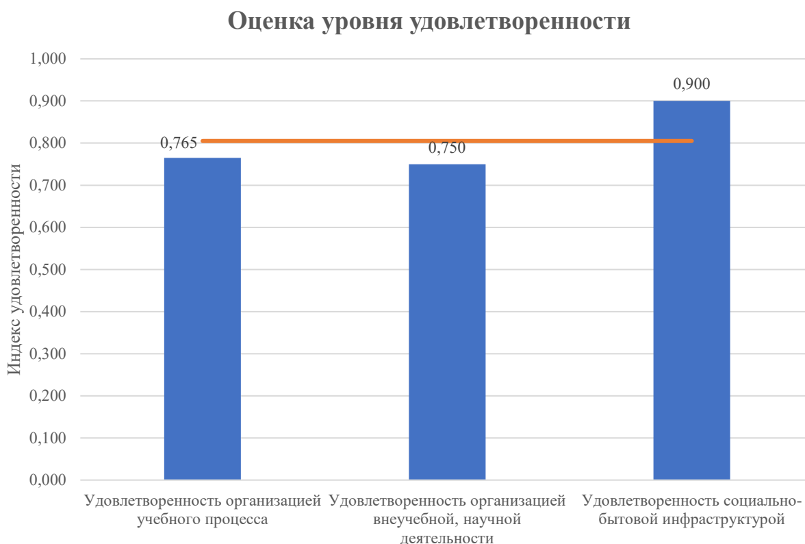
Рисунок 2. Средняя оценка удовлетворенности по всем блокам вопросов.

Средняя оценка удовлетворенности преподавателей по блоку вопросов « Удовлетворенность организацией учебного процесса» равна 0,765, что является показателем высшего уровня удовлетворенности (76-100%).